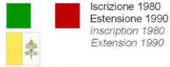
Tavola n° 1 di 1 Table n° 1 of 1